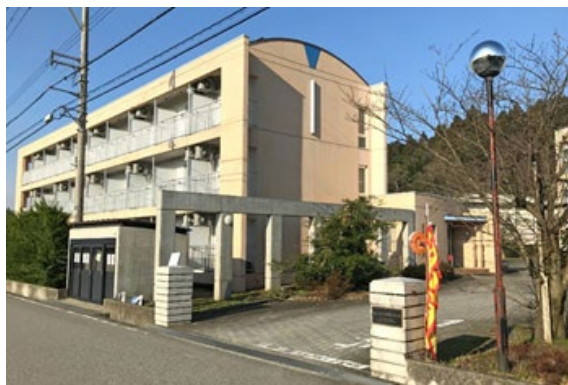
五福国際交流会館