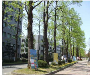
富山大学 (五福キャンパス)

富山大学のある富山市は県庁所在地であり、人口約41万人をかかえる近代的な都市である。北陸新幹線により、東京へは約2時間で移動が可能である。また、市内には富山空港（東京まで約1時間）がある。水と空気と海産物がおいしく、文化的施設の整っている便利なおもしろいところとして、全国的に住みやすい街の最上位にあげられている。