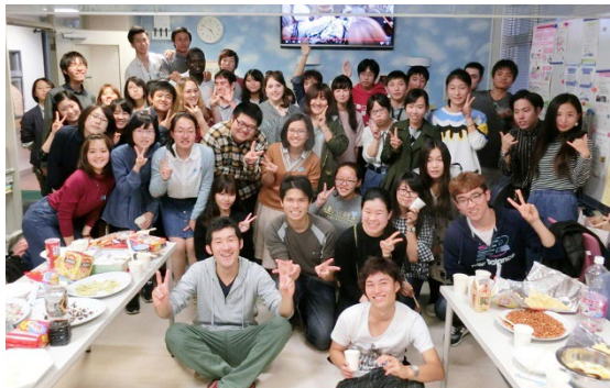
日本人学生主催 「ウェルカムパーティ」