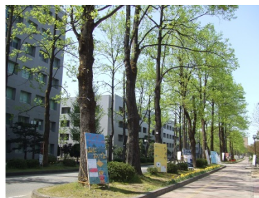
富山大学 (五福キャンパス)

富山大学のある富山市は県庁所在地であり、人口約42万人をかかえる近代的な都市である。北陸新幹線により、東京へは約2時間で移動が可能である。また、市内には富山空港（東京まで約1時間）がある。水と空気と海産物がおいしく、文化的施設の整っている便利なおとなとして、全国的に住みやすい街の最上位にあげられている。