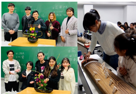
日本事情 「華道」 「日本の民謡」